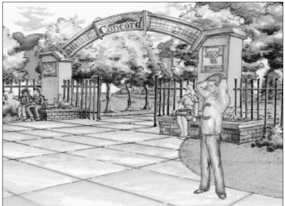
Descripción del artista de la entrada del proyecto El Dorado/Westwood