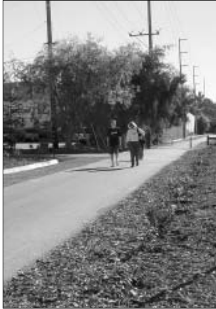
La terminación del Proyecto de Camino Regional de Iron Horse permite a los usuarios movilizarse desde Concord a Dublin.

La tan esperada apertura de Fry's, el almacén de electrónica al detal a gran escala, en el antiguo edificio Levitz en Park & Shop Center, en el 1695 de Willow Pass Rd., se espera en la primavera 2004. La compañía está trabajando en mejoras al edificio de 146,500 pies cuadrados (44,650 metros), así como en nuevos jardines e iluminación del estacionamiento. La Ciudad ha instalado un nuevo semáforo en Market Street para ayudar con el aumento de tráfico previsto para el área. Este es el primer almacén de Fry's en el