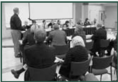
La participación de la comunidad será un factor clave para el informe exitoso del Plan General.