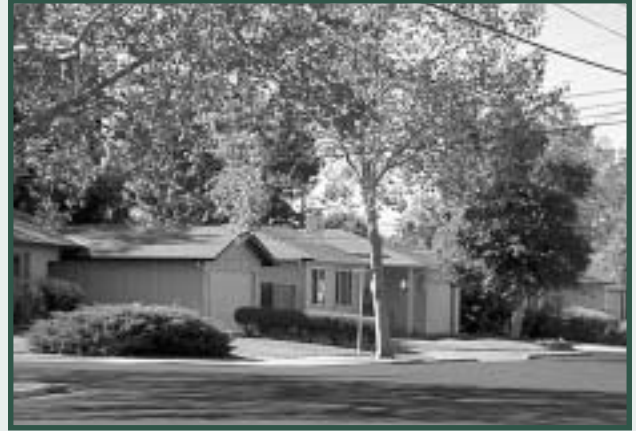
La Ordenanza de Zonificación asegura que el nuevo crecimiento y uso encajen dentro de los vecindarios existentes.

Utilizando información suministrada por el personal de la Ciudad y disponible mediante recursos compilados, la firma Diet and Bhatia preparó una serie de mapas que documentan los usos actuales de la tierra, las instalaciones públicas y las condiciones ambientales dentro de Concord. El Atlas de Mapas proporciona información de base sobre las condiciones existentes que tendrán influencia sobre el desarrollo futuro en la Ciudad de Concord. El Atlas usa mapas para ilustrar el suministro de tierra disponible en la Ciudad, lo cual orientará el proceso de toma de decisiones sobre crecimiento futuro y conservación.